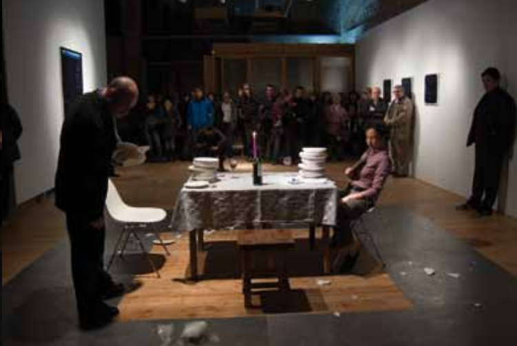
De vegades 1 + 1 no són 2. Zona Zàlata